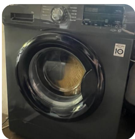
Ons kerstcadeau;) Na een jaar met de hand alles wassen, is dit een enorme verademing.