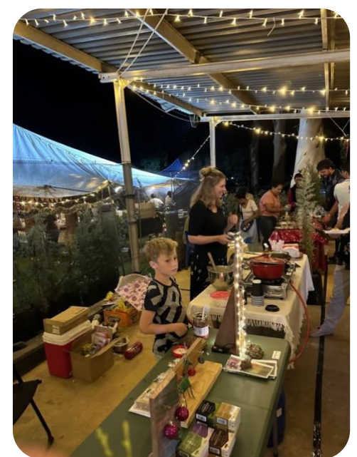
We stonden op de kerstmarkt in Kabwe. Hier hebben we onze Engelstaligen flyers uitgedeeld.