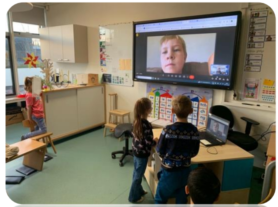
Heerlijk om even je klasgenoten digitaal te zien!