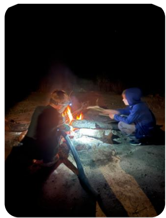
Het blijft leuk om een vuurtje te maken.